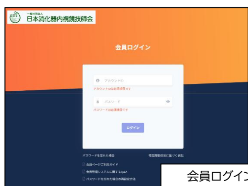
会員ログイン画面